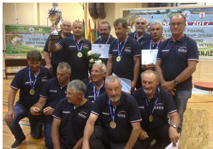
Équipe de France Vétérans, Championne du Monde 2017 //

“Un Sportif de haut niveau doit être respectueux de son capitaine et de son coach et appliquer leurs consignes. Il est animé par l'ambition de gagner et de contribuer au succès de son équipe tout en respectant ses co-équipiers et ses adversaires. ”