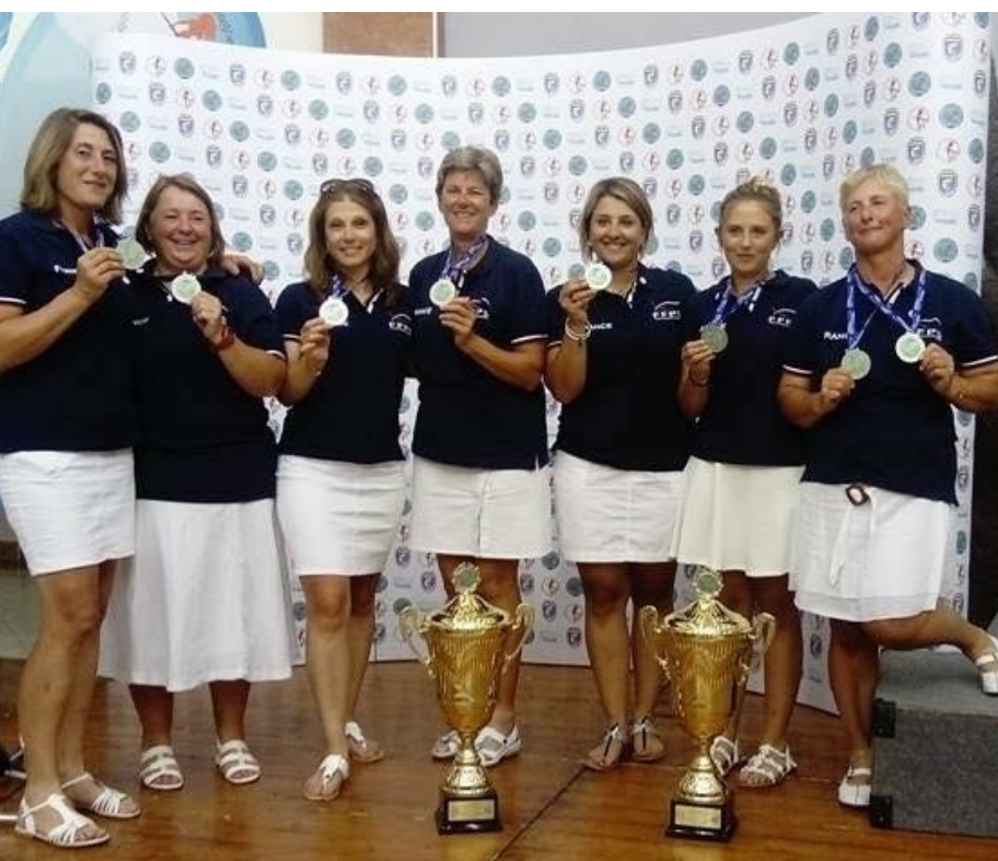
Équipe de France Féminine, Vice-Championne du Monde 2017 // Pologne