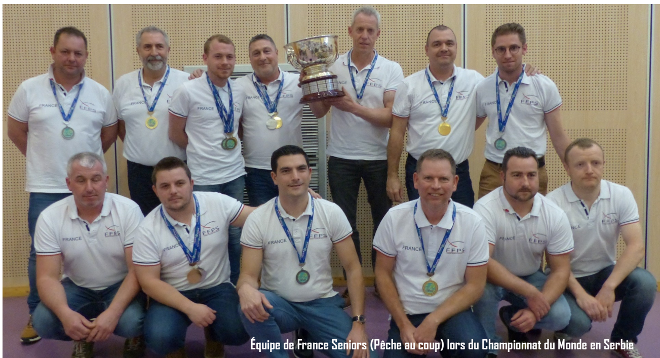
Équipe de France Seniors (Pêche au coup) lors du Championnat du Monde en Serbie