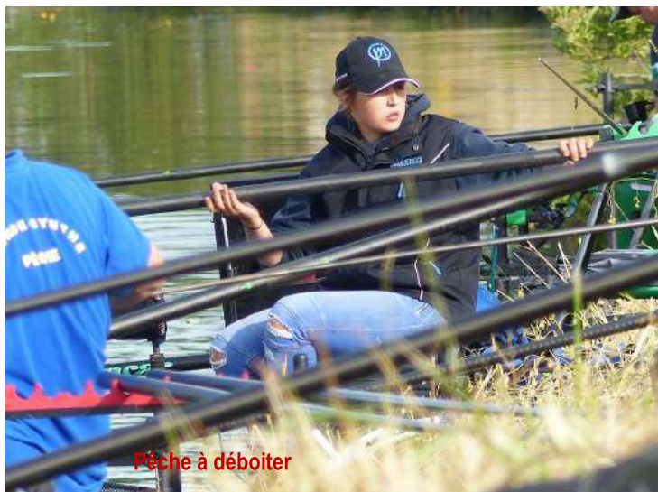
Pêche à déboîter