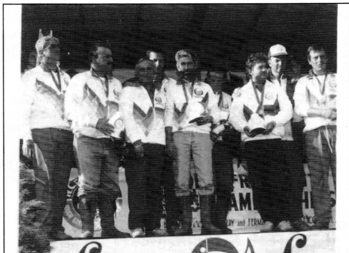
L'équipe d'Italie Championne du Monde