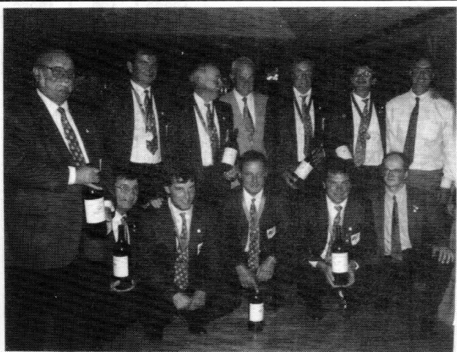
La Délégation Française