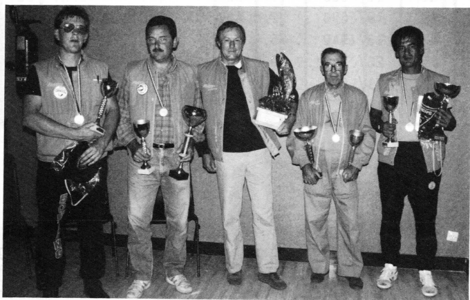
L'équipe de la R.A.T.P.

Samedi 26 août 1989, les responsables de la Fédération et du C.S.D. 67 se sont donnés rendez-vous avec les Ets Fischer's Distribution à la salle des fêtes de Mondelange, pour mettre au point les derniers préparatifs et procéder à la visite du parcours avant le Championnat de France.